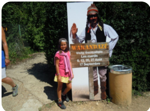
Le Mont Saint Romain