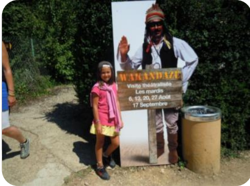
Le Mont Saint Romain