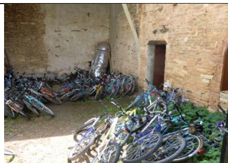
"Rangement" des vélos

Un parc annexe de 1ha situé à 300m du centre complète l'installation ancien moulin, il est traversé par un ruisseau le Bicheron.