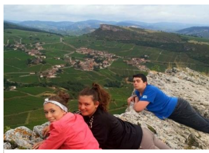
Vue du haut de la roche de Solutré