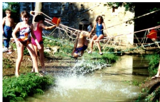
Le centre Jean Andros a fêté ses 60 ans en 2013