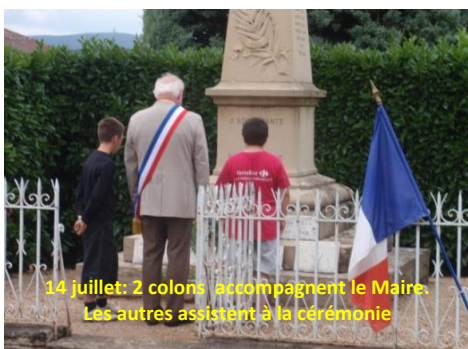
14 juillet: 2 colons accompagnent le Maire. Les autres assistent à la cérémonie